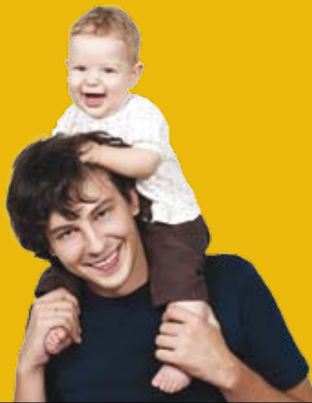
Графика: www.atelier-lev.com

в содействии с коллективом и экспертом терапии, проектная группа педиатров в менеджменте болевого синдрома.