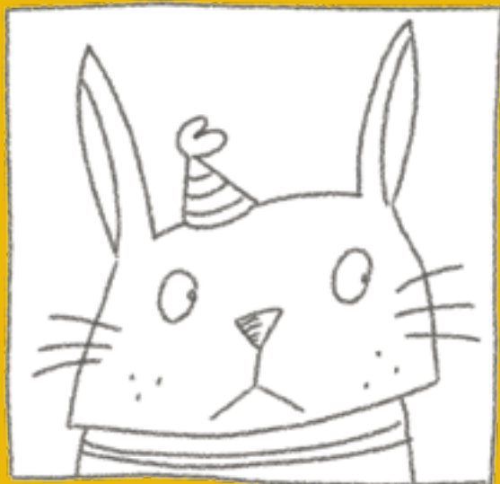
Рисунок © Inga Knopp-Kilpert